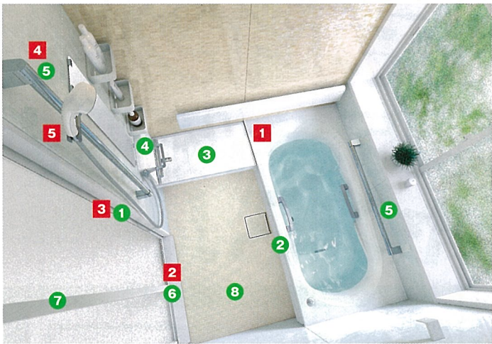
システムバスルーム サザナ 1坪サイズ Fタイプ 写真セット価格 1,666,100円(税・工事費別)