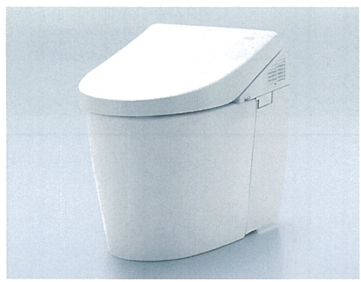
ネオレストAH 希望小売価格 334,000円(税・工事費別)