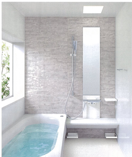
システムバスルーム サザナ (1坪サイズ 1717Tタイプ) 写真セット価格 834,000円～(税・工事費別) ※写真はイメージです。