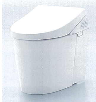
ネオレストAH1 希望小売価格 334,000円(税・工事費別)