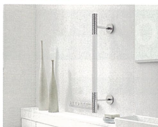
希望小売価格 15,600円～(税・工事費別) ※オプション