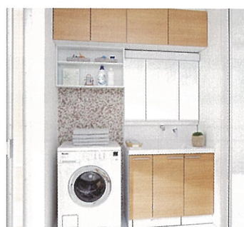
オクターブ 希望小売価格 389,300円(税・工事費別)