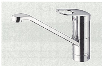
GGシリーズ TKGG31E 希望小売価格 29,100円(税・工事費別)