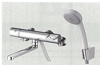
GGシリーズ TMGG40E 希望小売価格 39,800円(税・工事費別)