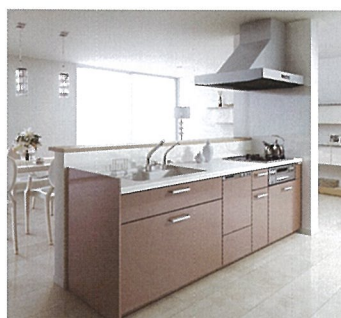
システムキッチン クラッソ 希望小売価格 1,634,200円(税・工事費別)